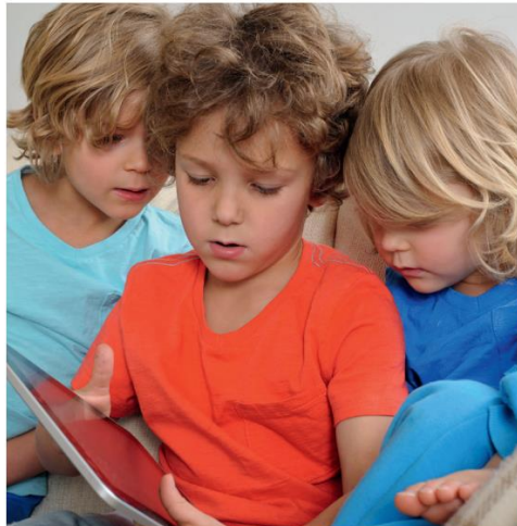
Tijdens het spelen raken de hoofden elkaar en kan hoofdluis zich verspreiden.

Hoofdluizen zoeken graag een warm plekje op; bijvoorbeeld in het haar achter de oren, in de nek of onder een pony. Kinderen krijgen gemakkelijk hoofdluis, omdat tijdens het spelen de hoofden elkaar soms raken. Hoofdluizen verspreiden zich ook makkelijk bij pubers. Dat kan bijvoorbeeld gebeuren bij het knuffelen, samen selfies maken of bij elkaar op de mobiel kijken.